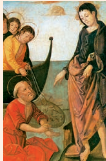
Jesús, Pere i la pesca miraculosa. Pintura de Rodrigo de Osona. Museu Provincial, València

Prohibieron a los apóstoles hablar en nombre de Jesús y los soltaron. Los apóstoles salieron del Sanedrín contentos de haber merecido aquel ultraje por el nombre de Jesús.