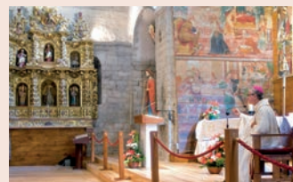
Interior de l'església d'Arties

En el marc del programa Catalonia Sacra de difusió del patrimoni cultural del bisbat d'Urgell, es proposa enguany la descoberta del romànic de la Val d'Aran el proper dia 23 de març. Es farà una visita guiada per tècnics de cultura del Coselh Generau a les esglésies de Santa Maria de Cap d'Aran de Tredòs; de Sant Andreu de Salar-dú; de Santa Eulàlia d'Unha; de Santa Maria d'Arties i de Sant Fèlix de Vilac, seguint una ruta ja establerta.