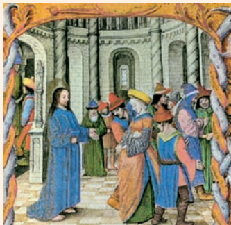
Miniatura sobre l'episodi de Crist i la dona adúltera. Del Breviari d'Isabel la Catòlica. British Library (Londres)

Al ir, iba llorando, / llevando la semilla; / al volver, vuelve cantando, / trayendo sus gavillas. R.