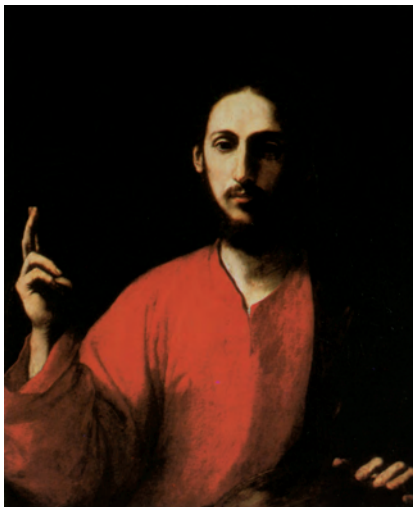
Jesucrist, el Salvador, pintura de José Ribera (1591-1652). Museu del Prado (Madrid)

Ellos salieron a predicar la conversión, echaban muchos demonios, ungían con aceite a muchos enfermos y los curaban.