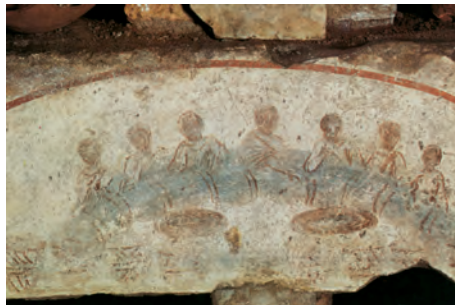
Una de les representacions més antigues de l'eucaristia és aquesta Fractio panis , que és a les Catacumbes de Sant Calixt, Roma (s. II)

Te ofreceré un sacrificio de alabanza, / invocando tu nombre, Señor. / Cumpliré al Señor mis votos / en presencia de todo el pueblo. R.