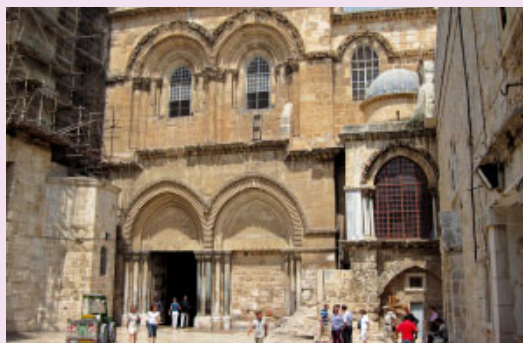
Església del Sant Sepulcre a Jerusalem

L'ocultament de Jesús en el sepulcre i la soledat el dia del dissabte suposaren per a Maria i els deixebles una experiència de Fe sense els signes visibles d'Aquell que n'era el centre i la font. Creien en Crist, però no el veien. Aquesta és la nostra situació com a creients enmig del món. Fins i tot ens manquen sovint en l'actual