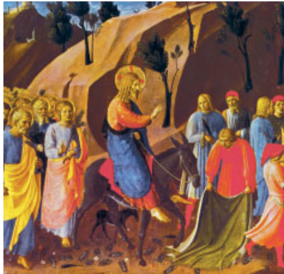
Entrada de Jesús a Jerusalem. Pintura del beat Fra Angèlic, Convent de Sant Marc (Florència)

Anunciaré als meus germans el vostre nom, / us lloaré enmig del poble reunit. / Fidels del Senyor, lloeu-lo, / fills de Jacob, glorifiqueu-lo, / reverencieu-lo, fills d'Israel. R.