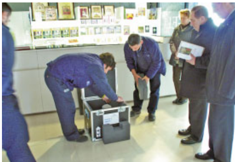
El Delegat de Patrimoni observa com es prepara la peça