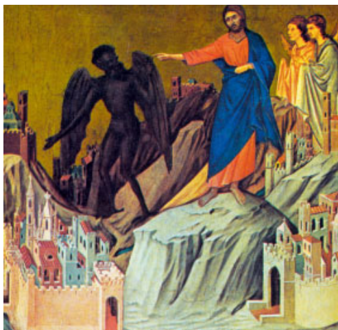
Crist rebutja les temptacions del Maligne. Obra del Duccio (1235-1319), Col·lecció Frick, Nova York

El Señor es bueno y es recto, / y enseña el camino a los pecadores; / hace caminar a los humildes con rectitud, / enseña su camino a los humildes. R.