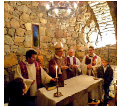
Un moment de la celebració