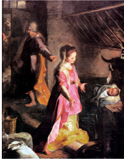
Santa Maria contemplat el seu fill Jesús. Pintura de Barocció, Museu del Prado, Madrid

Al cumplirse los ocho días tocaba circumcidat al niño, y le pusieron por nombre Jesús, como lo había llamado el ángel antes de su concepción.