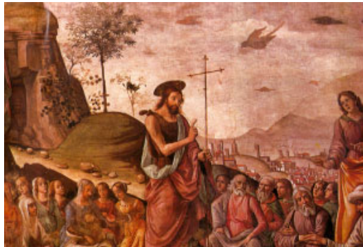
Predicació de sant Joan Baptista. Pintura de Domenico Ghirlandaio, església de Santa Maria Novella (Florència)

«Aquí está vuestro Dios. Mirad, el Señor Dios llega con poder, y su brazo manda. Mirad, viene con él su salario, y su recompensa lo precede. Como un pastor que apacienta el rebaño, su brazo lo reúne, toma en brazos los corderos y hace recostar a las madres.»