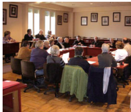
Reunió del Consell Diocesà de Càritas d'Urgell