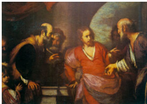
Jesús i els fariseus. Pintura d'Strozzi, Galleria degli Uffizi, Florència

Vosotros, en cambio, no os dejéis llamar maestro, porque uno solo es vuestro maestro, y todos vosotros sois hermanos. Y no llaméis padre vuestro a nadie en la tierra, porque uno solo es vuestro Padre, el del cielo. No os dejéis llamar consejeros, porque uno solo es vuestro consejero, Cristo. El primero entre vosotros será vuestro servidor. El que se enaltece será humillado, y el que se humilla será enaltecido.»