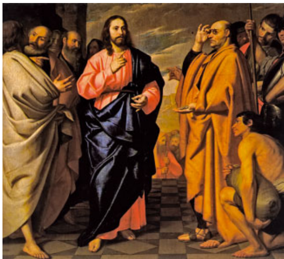
Jesús i els fariseus: el tribut al Cèsar. Pintura d'Antonio Arias († 1684). Museu del Prado, Madrid

Postraos ante el Señor en el atrio sagrado, / tiembale en su presencia la tierra toda; / decid a los pueblos: «El Señor es rey, / él gobierna a los pueblos rectamente.» R.