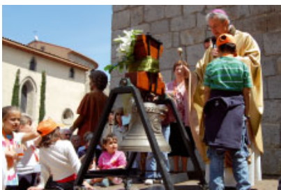
Benedicció de la campana en la celebració del 150è aniversari de l'Institut