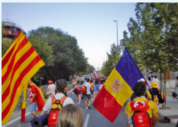
Els urgellencs a Madrid