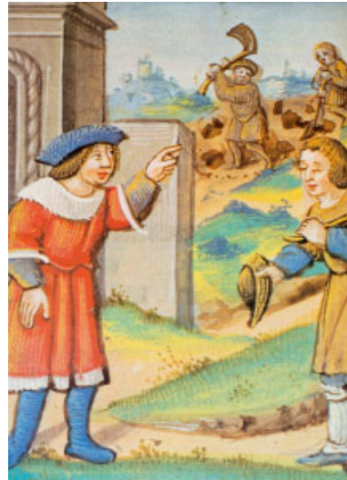
«Aneu també vosaltres a la meua vinya» (Evangelio d'avui). Gravats d'un evangelari. Biblioteca Nacional, Madrid