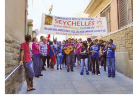
L'arribada a Guissona

Un grup de neocatecumenals de les Illes Seychelles i de Madagascar van estar del 16 al 17 d'agost a Guissona. Eren els únics representants del país a la JMJ. Van ser rebuts per un grup de voluntaris de la parròquia, van participar en les pregàries de Laudes i Vespres i la colla gegantera «Els Margeners» els van fer una breu exhibició castellera. Van ser acollits al Col·legi del Roser i els àpats van ser a la residència de la Fundació CAG. Van ser 24 hores molt intenses per a Guissona, que va poder viure de primera mà l'experiència de fe d'uns joves expressius i molt engrescats.