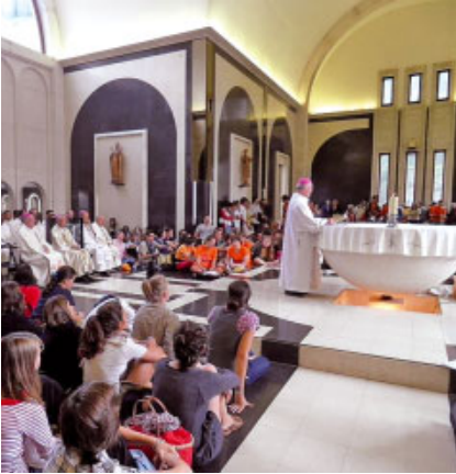
Missa a Meritxell

La pluja intensa que va caure al Principat no va impedir que cents de joves acollits a Andorra pujessin al Santuari de Meritxell per convertir-lo en una autèntica festa, amb les seves mascotes, banderes, samarretes i foulards de tots els colors.