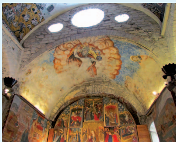
Frescos i retaule a l'altar major

Les pintures han estat restaurades, i destaquen per la seva bellesa. El retaule barroc de l'altar major de la catequesi sobre la Mare de Déu que podem admirar i seguir a través de les diferents taules que componen el retaule central de l'església i que van narrar el misteri marí de la seva vida, ja sigui recollida en els textos evan-