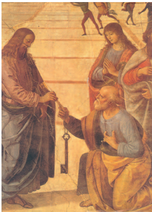
Crist lliura a sant Pere les claus del Regne del cel. Pintura de Perugino, Capella Sixtina (Ciutat del Vaticà)

¿Quién conoció la mente del Señor? ¿Quién fue su consejero? ¿Quién le ha dado primero, para que él le devuelva? Él es el origen, guía y meta del universo. A él la gloria por los siglos. Amén.