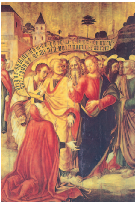
Crist i la dona cananea. Pintura de Lazzaro Bastiani, Museu de l'Acadèmia (Venècia)

En aquel tiempo, Jesús salió y se retiró al país de Tiro y Sidón. Entonces una mujer cananea, saliendo de uno de aquellos lugares, se puso a gritarle: «Ten compasión de mí, Señor Hijo de David. Mi hija tiene un demonio muy malo.» Él no le respondió nada. Entonces los discípulos se le acercaron a decirle: «Atiéndela, que viene detrás gritando.» Él les contestó: «Sólo me han enviado a las ovejas descarriadas de Israel.» Ella los alcanzó y se prosternó ante él, y le pidió de rodillas: «Señor, socórreme.» Él le contestó: «No está bien echar a los perros el pan de los hijos.» Pero ella repuso: «Tienes razón, Señor; pero también los perros comen las migajas que caen de la mesa de los amos.» Jesús le respondió: «Mujer, qué grande es tu fe: que se cumpla lo que deseas.» En aquel momento quedó curada su hija.