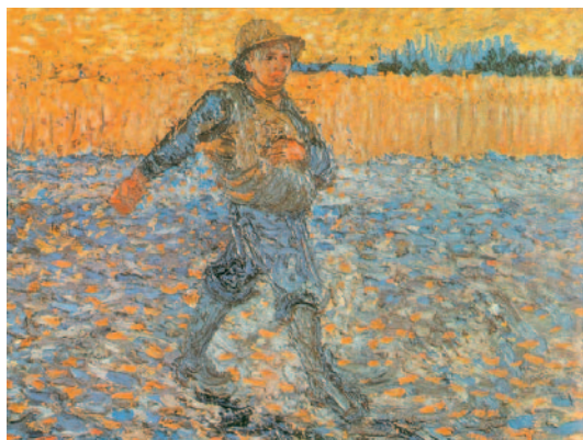
El sembrador. Pintura de Van Gogh. Col·lecció particular, Madrid

Las praderas se cubren de rebaños, / y los valles se visten de mieses, / que aclaman y cantan. R.