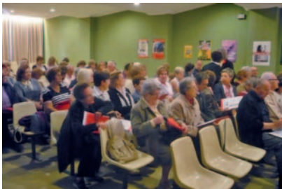
Voluntaris de Càritas a la darrera assemblea

R ecentment hem pogut celebrar les Assemblees de Càritas Diocesana i de Càritas Nacional d'Andorra, que ben agermanades són l'expressió viva de la caritat de tot el nostre Bisbat. En les assemblees hem aprovat sengles Memòries , és a dir, els reculls de l'acció i els programes de la caritat organitzada a la nostra Diòcesi en tot un any. Molta feina i molts recursos dels quals podem donar-ne gràcies a Déu! L'amor és responsabilitat de tots, i ben personalment, però també cal una certa organització de la comunitat cristiana en ordre a fer bé les coses i a programar-les amb major eficàcia i optimització. Càritas és la caritat de tota la nostra Diòcesi que fa visible i concret el rostre del Senyor misericordiós envers els qui passen carències i necessitats.