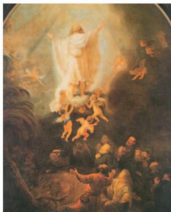
L'Ascensió. Pintura de Rembrandt, Alte Pinakothek, Munic (Alemanya)

En aquel tiempo, los once discípulos se fueron a Galilea, al monte que Jesús les había indicado. Al verlo, ellos se postraron, pero algunos vacilaban. Acercándose a ellos, Jesús les dijo: «Se me ha dado pleno poder en el cielo y en la tierra. Id y haced discípulos de todos los pueblos, bautizándolos en el nombre del Padre y del Hijo y del Espíritu Santo; y enseñándoles a guardar todo lo que os he mandado. Y sabed que yo estoy con vosotros todos los días, hasta el fin del mundo.»