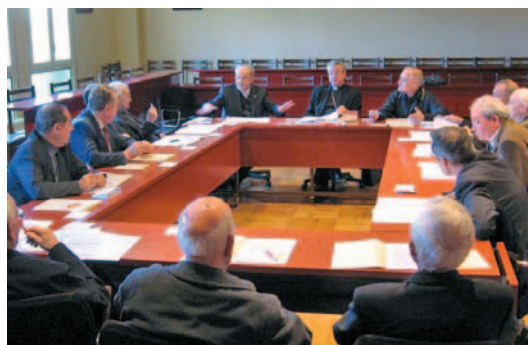
Un moment de la reunió