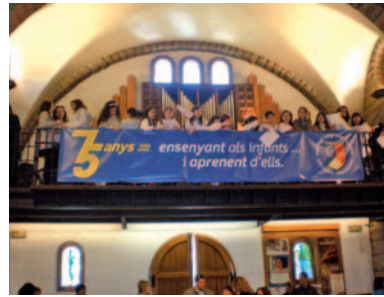
Aspecte de l'església durant la celebració