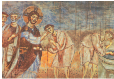
La curació del cec de naixement. Pintura d'un artista anònim, Escola de Casino (segle XI). Església de Sant Àngelo in Formis (Caserta, Itàlia)

Oh, sí! La vostra bondat i el vostre amor / m'acompanyen tota la vida, / i viuré anys i més anys / a la casa del Senyor. R.