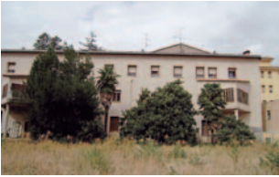
Les obres al nou centre

El proper 26 de març és previst que es dugui a terme la inauguració del nou centre d'atenció de Càritas a Balaguer, en un acte presidit per l'Arquebisbe d'Urgell, Mons. Joan-Enric Vives, i que comptarà amb la presència de destacades autoritats de la ciutat i de la parròquia. El nou centre que Càritas ha disposat se situa en l'emblemàtic edifici de la comunitat franciscana de Sant Domènec, al centre de Balaguer. Es tracta d'una planta de 500 m 2 dedicada a donar aixopluc als serveis d'acollida, de formació i d'atenció als usuaris de Càritas. La reforma d'aquest espai, que ha culminat una tasca de més de quasi tres anys, ha requerit una profunda remodelació de les sales i dels seus equipaments i que suposen un pas endavant molt important en la presència de l'ONG de l'Església.