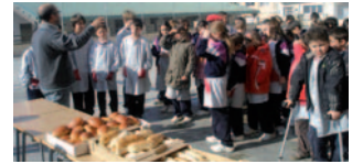
Els infants durant l'àpat solidari

El passat divendres 18 de febrer, els alumnes i professors de l'Escola Bonavista van celebrar un esmorzar solidari per a col·laborar amb el projecte de Mans Unides 2011, aquest any destinat a la construcció de sis aules per a escoles de l'Estat Tamil Nadu, districte Namakal de la Índia. El total de diners que s'ha recollit ha estat de 207,32 euros. Donem gràcies per la seva col·laboració, a tots els nens i nenes, professors i al Forn Palau de Bellcaire, que un any més ha regalat els panets que s'han menjat per esmorzar.