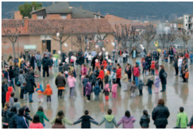
La celebració a l'escola de Ponts

A moltes escoles del Bisbat es va celebrar el passat 28 de gener el Dia Escolar de la no violència i la pau. Una diada que vol recordar l'anniversari de la mort de Mahatma Gandhi, el 30 de gener de 1948. I que es treballa des de molts àmbits i assignatures escolars, també des de l'àrea de religió, on els valors de la pau i la no violència hi són molt presents. A l'escola de Ponts es va organitzar un seguit d'activitats al llarg del dia i es va acabar amb un acte conjunt, on va participar tot l'alumnat, així com els mestres, pares i algunes padrines que també es van fer presents. Els alumnes de 6è van fer lectura d'un manifest on demanaven un món on la pau i el diàleg omplissin el cor de les persones. Després, es van enlairar uns globus, portant un missatge de pau en diferents llengües, cap al cel ennuvolat, tot seguit es va fer una cadena d'abraçades entre els nens i adults que van formar cercles al pati.