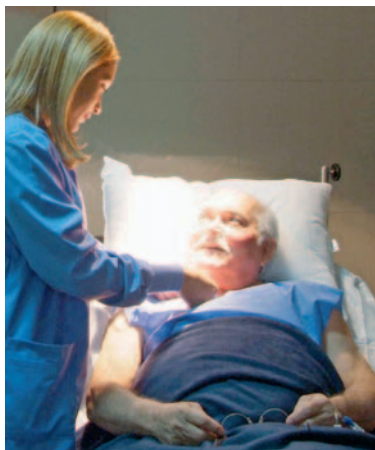
La comunitat cristiana acull, acompanya, sosté els malalts i els familiars

L a festa de la Mare de Déu de Lourdes, tan celebrada a la nostra Diòcesi i arreu, ens porta també la celebració mundial del Dia del malalt , instituïda pel Papa Joan Pau II, que tant ens va saber ensenyar sobre l'amor als malalts, i sobre l'aprenentatge de saber ser malalt un mateix. Lourdes, a l'altra banda del nostre Pirineu, un dels santuaris més estimats de tot el poble cristià, és el lloc i alhora el símbol d'esperança i de gràcia en el sentit d'acceptació i d'oferiment del sofriment que esdevé salvador. Tothom pot trobar a Lourdes un exemple de l'amor cristià als malalts, un signe patent de la seva preferència en el Regne de Déu, i del gran valor que ells, amb el seu sofriment unit a la Creu de Crist, representen dins la comunitat eclesial.