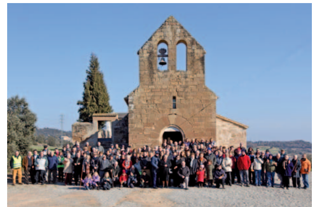
Sant Sebastià a Ponts