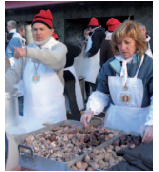
Sant Sebastià a Sant Julià de Lòria

de gener, de bon matí l'ajuntament preparà una foguera davant de l'església per rebre als pontsicans i pontsicanes que, tot caminant o bé en cotxe, fan els 5 km que hi ha des de Ponts. Després compartiren un esmorzar popular, i als volts de les dotze del migdia la petita campana de l'espada del temple anuncia a l'inici de la missa dedicada al sant màrtir.