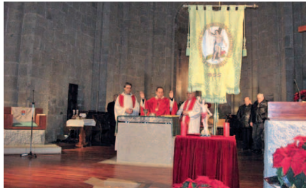
Sant Sebastià a la Seu d'Urgell

La diòcesi ha celebrat en moltes de les seves parròquies les populars i tradicionals festes de Sant Antoni i de Sant Sebastià. La convocatòria de les escudelles, un acte familiar i de trobada ciutadana per excel·lència, va estar precedit sempre de la Missa solemne, presidida pels rectors de cada parròquia. Es van beneir els panets i/o després es va fer la benedicció de bestiar, en el cas de Sant Antoni.