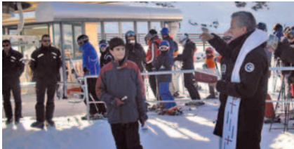
Un moment de la benedicció