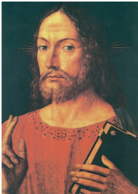
Crist, mestre i amic. Pintura d'Albert Dürero (1471-1528). Ciutat del Vaticà. Apartament del Sant Pare

En aquel tiempo, al ver Jesús el gentío, subió a la montaña, se sentó, y se acercaron sus discípulos; y él se puso a hablar, enseñándoles: «Dichosos los pobres en el espíritu, porque de ellos es el Reino de los cielos. Dichosos los que lloran, porque ellos serán consolados. Dichosos los sufridos, porque ellos heredarán la tierra. Dichosos los que tienen hambre y sed de la justicia, porque ellos quedarán saciados. Dichosos los misericordiosos, porque ellos alcanzarán misericordia. Dichosos los limpios de corazón, porque ellos verán a Dios. Dichosos los que trabajan por la paz, porque ellos se llamarán los Hijos de Dios. Dichosos los perseguidos por causa de la justicia, porque de ellos es el Reino de los cielos. Dichosos vosotros cuando os insulten y os persigan y os calumnien de cualquier modo por mi causa. Estad alegres y contentos, porque vuestra recompensa será grande en el cielo.»