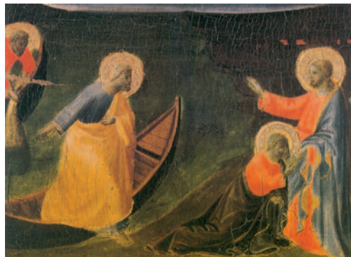
Jesús crida els germans Pere i Andreu. Pintura d'Andrea di Giusto, Església de Sant Andreu, Ripalta (Itàlia)

Espero gozar de la dicha del Señor / en el país de la vida. / Espera en el Señor, sé valiente, / ten ánimo, espera en el Señor. R.