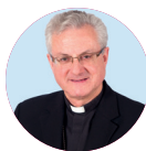
† Joan-Enric Vives i Sicília Arquebisbe d'Urgell

Sostinguem l'Església. Donem suport al que valorem i estimem, des del que cadascú té i pot. Són moltes les activitats amb repercussió clarament social que l'Església i les seves institucions estan gestionant en el present del nostre país. Les religions, pel fet d'existir en una societat, van aportant permanentment valors de solidaritat, de respecte, de fraternitat i de perdó. La vida i l'acció de l'Església són una aportació essencial i eficaç a l' hora de construir una societat harmònica, madura, justa i pacífica. Per això l' hem de voler ajudar.