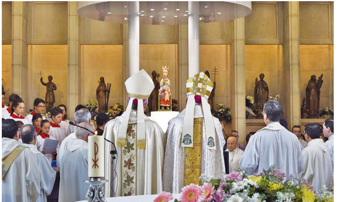
Moment d'una celebració al Santuari