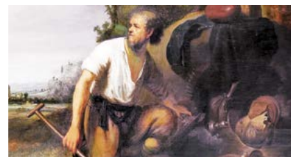
Paràbola del tresor amagat (1630) de Rembrandt. Museu de Belles Arts de Budapest (Hongria)