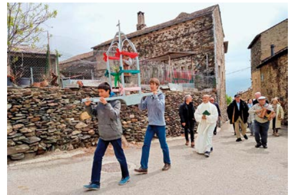
Processó a Guils de Cerdanya

Agramunt va acollir la tradicional benedicció de Sant Isidre, el 20 de maig. En aquest cas, un centenar de tractors i maquinària per al camp van participar-hi amb els pagesos que els menaven i les seves famílies. L'acte fou organitzat, un any més, per l'Associació d'Agricultors Verge dels Socós. La be-