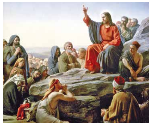
Sermó de la muntanya (1877), de Carl Bloch. Museu Nacional d'Història, Hillerød (Dinamarca)