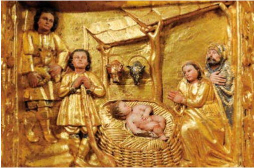
Fragmento del retablo del siglo XVII de Sant Iscle y Santa Victòria de La Massana (Principat d'Andorra)