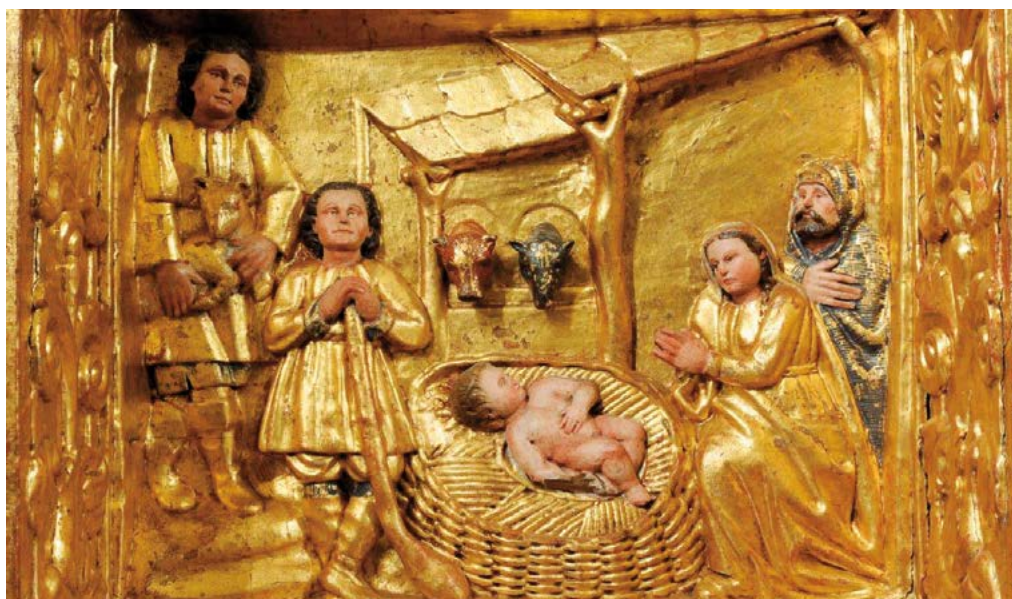
Detall del retaule del segle XVII de Sant Iscle i Santa Victòria de La Massana (Principat d'Andorra)