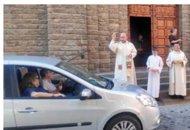
Sant Cristòfol a Ribes de Freser

diumenge 10 de juliol, es va celebrar la memòria de Sant Cristòfol amb la tradicional benedicció de vehicles, camions, bicicletes i mitjans de transport. La tradició catòlica el descriu com un gegant cananeu, que abans de la seva conversió al cristianisme ajudava els viatgers a travessar un perillós gual portant-los sobre els seus muscles; vivia sol al bosc. Altres tradicions situen el lloc a Lícia. La llegenda afirma que en una ocasió, va aju-