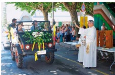
Sant Cristòfol a La Seu d'Urgell

diumenge 10 de juliol, es va celebrar la memòria de Sant Cristòfol amb la tradicional benedicció de vehicles, camions, bicicletes i mitjans de transport. La tradició catòlica el descriu com un gegant cananeu, que abans de la seva conversió al cristianisme ajudava els viatgers a travessar un perillós gual portant-los sobre els seus muscles; vivia sol al bosc. Altres tradicions situen el lloc a Lícia. La llegenda afirma que en una ocasió, va aju-