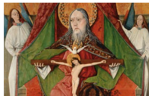
La Santíssima Trinitat (1471), Master GH. Església de la Trinitat, Mosóc (Eslovàquia)

«Déu, donant-nos l'Esperit Sant, ha vessat en els nostres cors el seu amor»