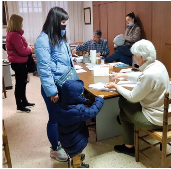
Càritas oferint el suport de la comunitat cristiana de Guissona als nouvinguts

La Parròquia de Guissona, juntament amb l'Ajuntament, Càritas diocesana, empreses privades i particulars, han acollit en les darreres setmanes 157 persones procedents d'Ucraïna. Els darrers, el dissabte 12 de març, procedents d'un