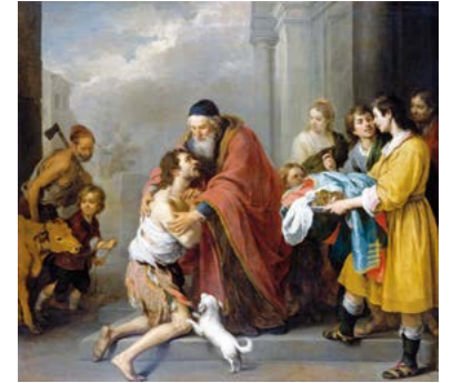
El retorn del fill pròdig (1667-1670) de Bartolomé Murillo. Galeria Nacional d'Art, Washington DC (EUA)