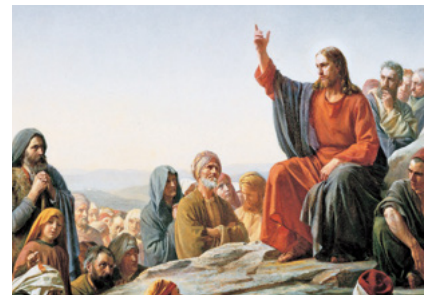
Sermó de la muntanya (1877), de Carl Heinrich Bloch