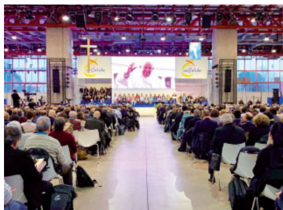
Aspecte general del congrés