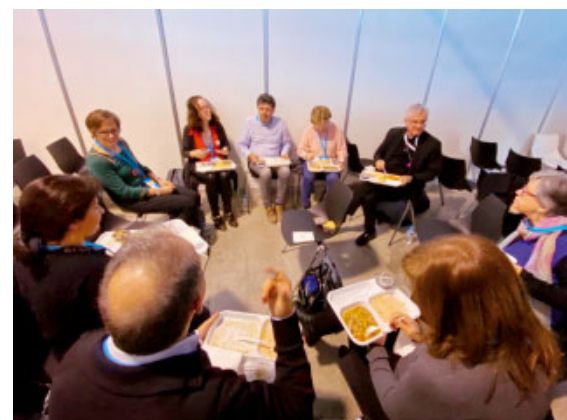
Els participants en un taller de la jornada