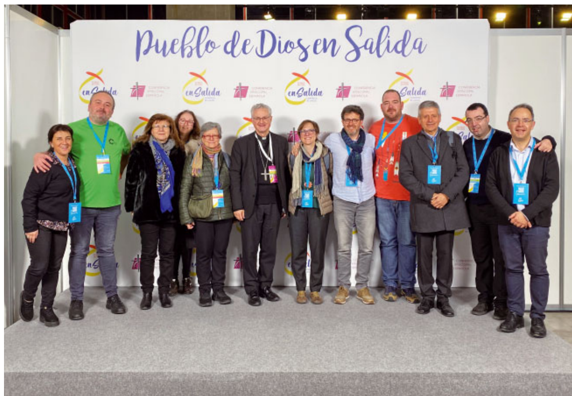
Els participants en el Congrés de Laics «Poble de Déu en sortida»

U n grup de 12 participants amb l'Arquebisbe Joan-Enric i el Vicari de Pastoral Mn. Antoni Elvira, van participar dels dies 14 al 16 de febrer al Congrés de Laics «Poble de Déu en sortida» que organitzava a Madrid la Comissió episcopal d'Apostolat Seglar de la Conferència Episcopal Espanyola (CEE). L'objectiu és impulsar la conversió pastoral i missionera del laïcat en el Poble de Déu, com a signe i instrument de l'anunci de l'Evangelí als homes i dones d'avui. Hi van assistir més de 2.000 persones de totes les diòcesis d'Espanya i dels diferents moviments laicals. En un clima de molta comunió eclesial els congressistes d'Urgell van inserir-se dins dels 80 grups de treball que es van centrar en quatre itineraris: primer anunci, acompanyament, formació i presència del laïcat en la vida pública. Quatre eixos marcats per tres línies d'actuació claus com ho són la sinodalitat, el discerniment i la presència en el món.