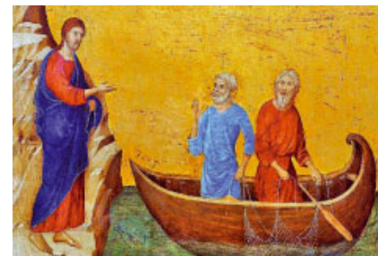
La crida dels apòstols Pere i Andreu (1308), de Duccio di Buoninsegna. Galeria Nacional d'Art, Washington (EUA)