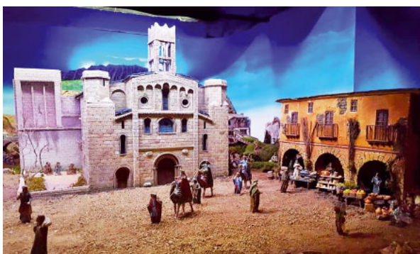
Pessebre a Sant Fèlix de Castellciutat