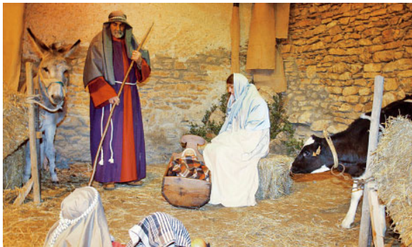
Pessebre vivent a Prullans

També molts pobles i esglésies han fet pessebres, més o menys monumentals, que ens acosten el naixement de Jesús. La Catedral de Santa Maria, i també els pobles importants de cada arxiprestat, mostren la feina d'artesans que amb la seva cura i bon fer construeixen petites o grans obres d'art. En aquest sentit, el pessebre que es pot visitar a l'església de Sant Fèlix de Castellciutat, en horari de 17 a 19 h, aquest mateix cap de setmana i tota la setmana de Nadal i fins al dia de Reis, és un reflex de la comarca del Baridà, que inclou ambients com la pròpia Catedral de Santa Maria. A la Llar de Sant Josep, a La Seu d'Urgell, també es pot gaudir d'un pessebre de gran qualitat i detall en un diorama obert al públic en horari de tardes. Una delícia per als infants.