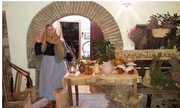
Pessebre vivent a Organyà