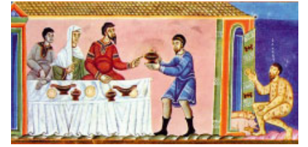
Llätzer i Epuló, detall de la miniatura del Codex Aureus d'Echternach (1035-1040). Museu Nacional Germànic, Nuremberg (Alemanya)

Un dels gran problemes de la riquesa és que el ric s'obsessiona amb els diners i no té ni temps ni ganes de preocupar-se dels altres i de les seves necessitats, per tant no solament deixen d'estimar Déu sinó també el proïsme. Ho veiem a les lectures d'avui. Un cop més, Amós denuncia els rics: S'estiren en llits de marfil..., mengen els anyells més tendres, improvisen al so de l'arpa, beuen vi en grans copes, s'ungeixen amb els perfums. Però el pitjor és que no els fa cap pena el desastre de les tribus de Josep, és a dir, no es preocupen del poble i es creuen segurs en la seva riquesa quan dins de pocs anys caurà el desastre sobre tots ells. Però als rics això no els preocupa. I això que també ells rebran el càstig: Seran els primers en les files dels deportats; així s'acabarà l'orgia dels vividors.