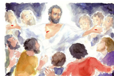
Stette in mezzo a loro (Ell es va quedar al mig d'ells), 2014. Aquarel·la de Maria Cavazzini Fortini

E l discurs de Pere al recinte del Temple ve motivat per la guarició del coix invàlid de naixement (3,1s) i la posterior reacció de tot el poble que lloava Déu , i del mateix coix curat que no se separava de Pere i Joan .