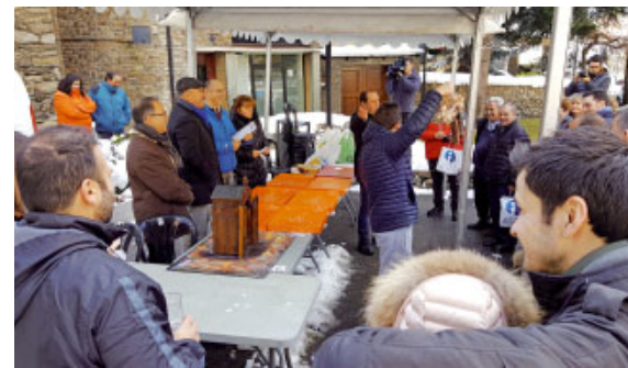
A Encamp, subhasta dels Encants a benefici de Càritas