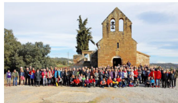
Pelegrinatge a l'església de Sant Sebastià del Gos, a Ponts