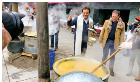
Benedicció de les olles a Sant Julià de Lòria