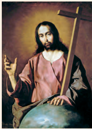
El Salvador beneït. Pintura de F. Zurbarán (1598-1664), Museu del Prado (Madrid)

»Ahora mi alma está agitada, y ¿qué diré?: Padre, líbrame de esta hora. Pero si por esto he venido, para esta hora. Padre, glorifica tu nombre.» Entonces vino una voz del cielo: «Lo he glorificado y volveré a glorificarlo.» La gente que estaba allí y lo oyó decía que había sido un trueno; otros decían que le había hablado un ángel. Jesús tomó la palabra y dijo: «Esta voz no ha venido por mí, sino por vosotros. Ahora va a ser juzgado el mundo; ahora el Príncipe de este mundo va a ser echado fuera. Y cuando yo sea elevado sobre la tierra atraeré a todos hacia mí.» Esto lo decía dando a entender la muerte de que iba a morir.