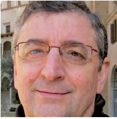
Aquesta imatge parla